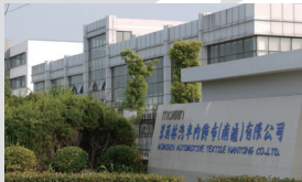
5 茉莉林汽車内飾布(南通)有限公司