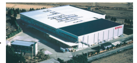
モリリン物流株式会社つくばセンター